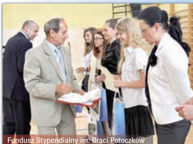
Fundusz Stypendialny im. Braci Potoczków

„Sądecznanin”, wydawany od stycznia 2008 r. przez Fundację Sądecką, to comiesięczna solidna dawka wiedzy i bieżących informacji o Nowym Sączu i regionie. W krótkim czasie miesięcznik zdobył sobie mocną pozycję na rynku wydawniczym. Czytelnicy docenili profesjonalizm, niezależność i obiektywizm redaktorów pisma. Po „Sądecznanina” sięga każdy szanujący się Sądeczanin.