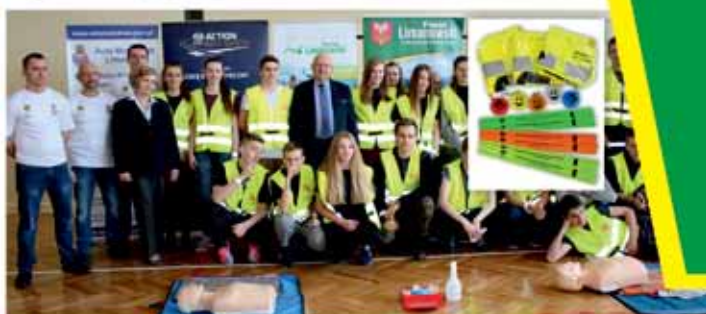
Realizacja od 2015 r. projektu „Bezpieczniej na drogach w Powiecie Limanowskim” - 14 tys. materiałów odblaskowych, prelekcje dot. bezpieczeństwa