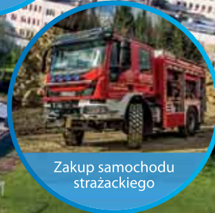
Zakup samochodu strażackiego