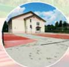
Parking przy ZS w Stróżówce