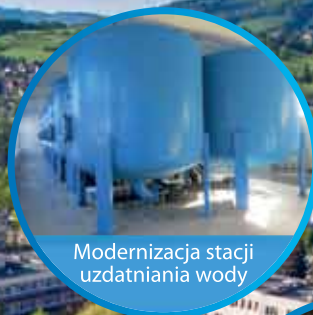
Modernizacja stacji uzdatniania wody