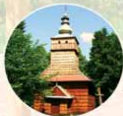
Cerkiew pw. Narodzenia Bogurodzicy z 1790 r.

Gmina Gorlice zdobyła szereg nagród i wyróżnień, m.in.: ósmie miejsce w Rankingu Samorządów „Rzeczpospolitej” 2014 w kategorii gmina wiejska. Za działalność na rzecz ochrony środowiska naturalnego otrzymała EUROPEJSKĄ NAGRODĘ EKOLOGICZNĄ , wyróżnienie w kategorii eko-gmina wiejska w konkursie „Eko-liderzy 20-lecia” , a także wyróżnienie i tytuł Sportowej Gminy 2013 , tytuł „Przyjazny urząd” w rankingu przejrzystości gmin województwa małopolskiego.