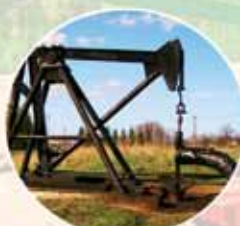
Kiwony i trójnogi