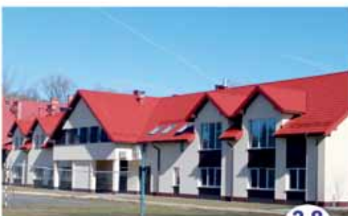
Budowa nowej części Specjalnego Ośrodka Szkolno - Wychowawczego w Dobrej