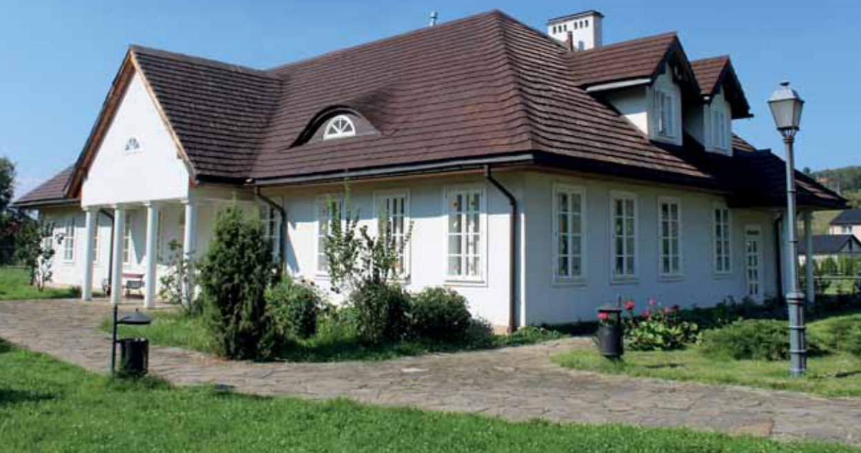
Budynek Dworu z Łososiny Dolnej po remoncie, Muzeum Okręgowe w Nowym Sączu.

BUDOWNICTWO ZEROEMISYJNE OCHRONA PRZECIWPOŻAROWA DREWNA RENOWACJA ZABYTKÓW WEŁNA OWCZA WZMOCNIENIA STRUKTURALNE ZA POMOCĄ MATERIAŁÓW KOMPOZYTOWYCH