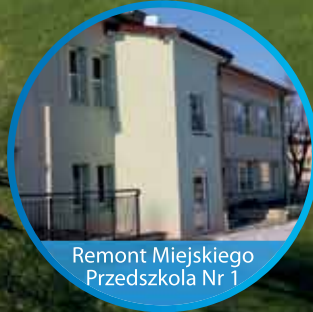
Remont Miejskiego Przedszkola Nr 1