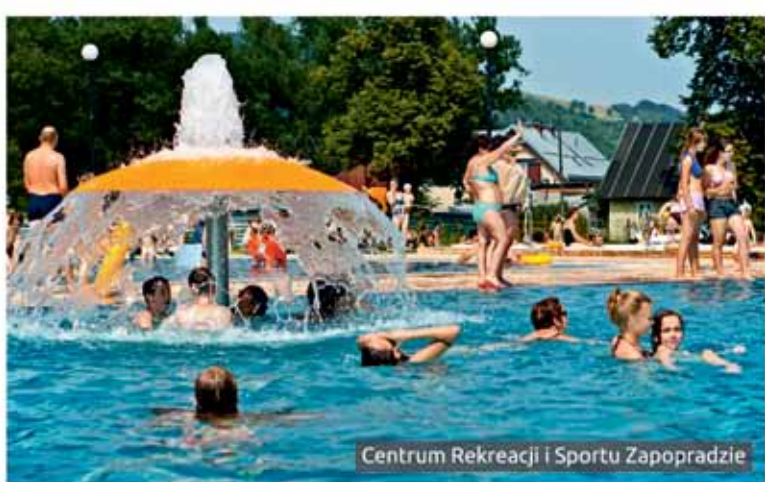
Centrum Rekreacji i Sportu Zapopradzie

gactwem smaku, ilością cennych pierwiastków i minerałów. Są na tyle istotnym aspektem życia Muszyny, że co roku początkiem sierpnia organizowany jest „Festiwal Wód Mineralnych”, który przyciąga do kurortu prawdziwe rzesze turystów. Jak na prawdziwe kulturalne uzdrowisko przystało w sezonie artystycznym cały czas dzieje się coś ciekawego. Chyba każda TOPowa gwiazda polskiej sceny muzycznej gościła już na deskach muszyńskiego amfiteatru. Nie sposób wymienić wszystkie wydarzenia kulturalne ale wśród ciekawszych warto wspomnieć Noc Świętojańską, Piknik Majowy, Jarmarki Regionalne, Galicyjskie Spotkania Jazzowe, Jesień Popradzką, Festiwal Piosenki Turystycznej, Festiwal Dzieci Gór, a także Musicale. Te ostatnie koniecznie trzeba zobaczyć goszcząc w uzdrowisku. Były inspirowane bogatą historią i kulturą Muszyny pełną czarownic, wodnych panien czy rozbójników i harników wszechobecnych w dawnym Państwie Muszyńskim. Oprócz interesujących widowisk Muszyna cieszy wieloma atrakcjami oraz oferuje możliwość ciekawego spędzenia czasu o każdej porze roku. Bardzo dobrze wyposażona baza