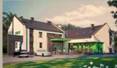
Ośrodek Zdrowia Gołkowice

Urząd Miejski w Starym Sączu, 33-340 Stary Sącz, ul. Stefana Batorego 25 stary.sacz.pl , facebook.com/gminastarysacz Tel. 18 446 02 70 / fax 18 446 02 7