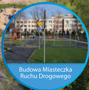
Budowa Miasteczka Ruchu Drogowego