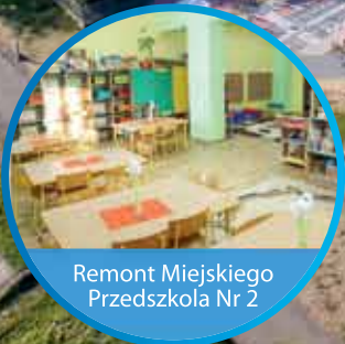
Remont Miejskiego Przedszkola Nr 2