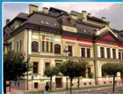
MCK Sokol w Nowym Sacz