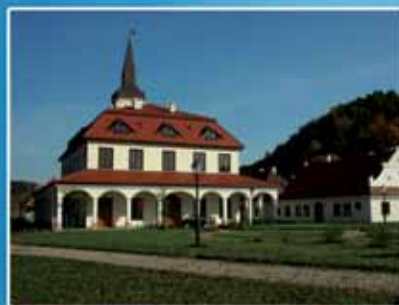
Fragment Miasteczka Galicyjskiego