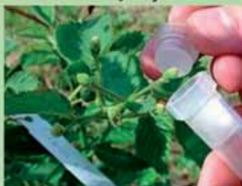
Rozmnażanie „in vitro