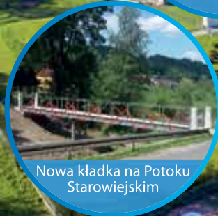
Nowa kładka na Potoku Starowiejskim