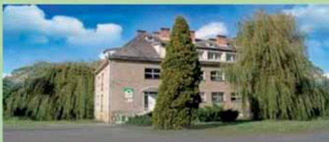
Biurowiec SZD Brzezna