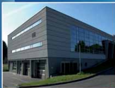
Salon Mercedes w Krakowie