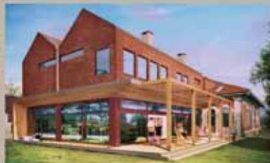
Biblioteka Stary Sącz