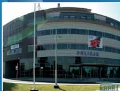
VI Komisarjat Policji Centrum Bezpieczenstwa w Krakowie