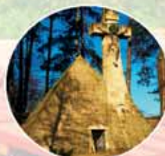
Mauzoleum Skrzyńskich i Sobańskich w Zagórzanach